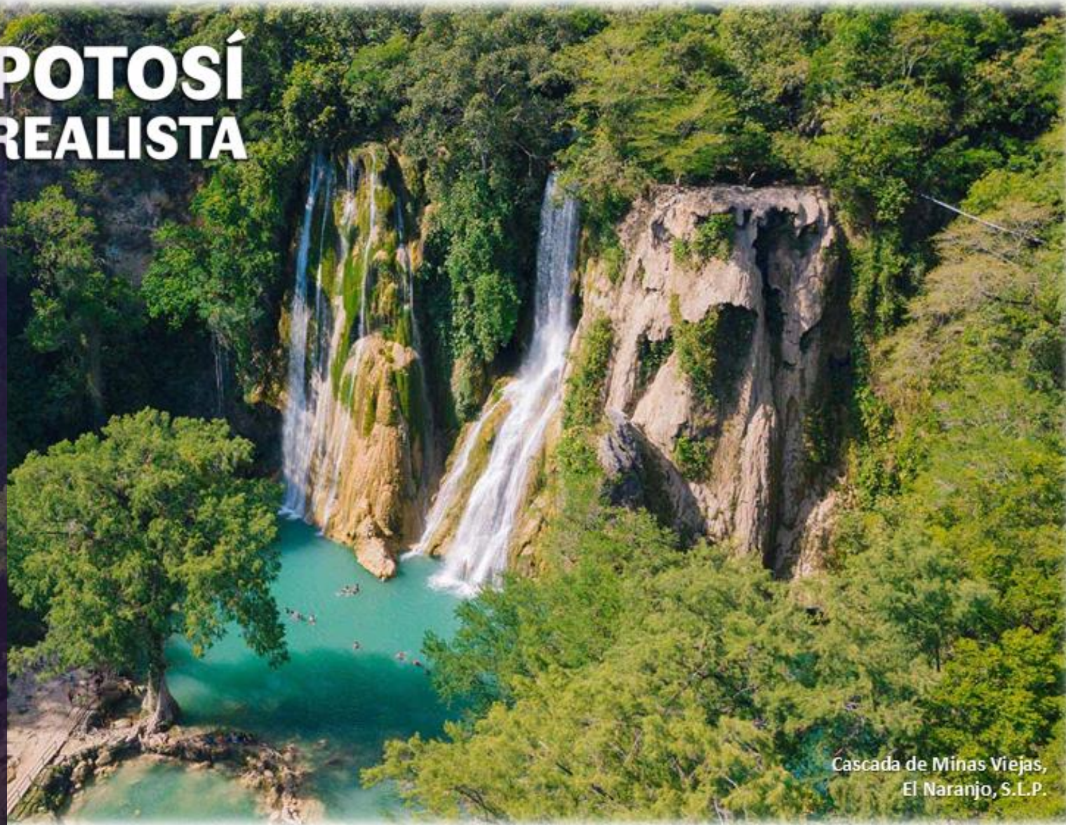
Cascada de Minas Viejas, El Naranjo, S.L.P.